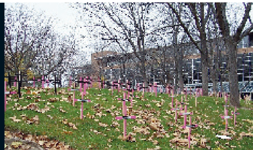
Herdenkingsmonument voor de vermoorde vrouwen in Juárez.